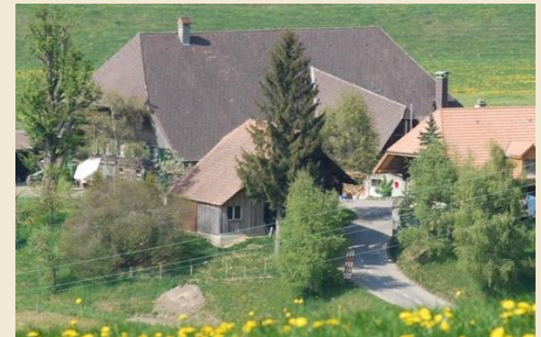
La ferme Haslibach 2022

32. Celui qui a composé ce petit chant, a péri en prison ; par amour pour les pécheurs. Un homme lui a apporté plume et l'encre ; il nous l'offre pour une bonne nuit.